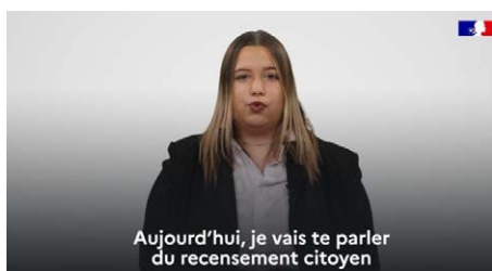
Image extraite de la vidéo « Faire son recensement citoyen obligatoire » de la Direction interministérielle du numérique.

En valorisant cette ressource, vous contribuez à simplifier les démarches administratives pour les jeunes et à les encourager à s'inscrire pleinement dans la vie citoyenne.